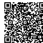
Link zum ESVG

Der öffentliche Gesamthaushalt umfasst dabei sowohl die Kernhaushalte (Bund/Länder, Gemeinde-/verbände, Sozialversicherungen) als auch die Extrahaushalte. Letztere beinhalten alle öffentlichen Fonds, Einrichtungen und Unternehmen, die nach den Kriterien des Europäischen Systems Volkswirtschaftlicher Gesamtrechnungen (ESVG) dem Sektor Staat zugeordnet sind. Extrahaushalte sind institutionelle Einheiten, die vom Staat kontrolliert und überwiegend vom Staat finanziert werden. Weiterhin muss die Einheit ein Nichtmarktproduzent sein. Dies liegt vor, wenn die Einheit keine wirtschaftlich signifikanten Preise erhebt. In der Regel liegt der Eigenfinanzierungsgrad eines Nichtmarktproduzenten unter 50 Prozent. Erwirtschaftet eine Einheit ihre Umsätze größtenteils mit dem Staat (mehr als 80 Prozent), handelt es sich um einen Hilfsbetrieb des Staates und die Einheit wird ebenfalls dem Sektor Staat als Extrahaushalt zugeordnet.