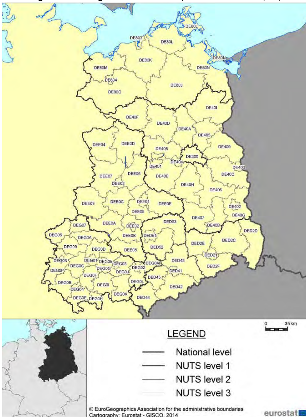
Abbildung 6: NUTS-3-Regionen der Bundesrepublik Deutschland (Ost)