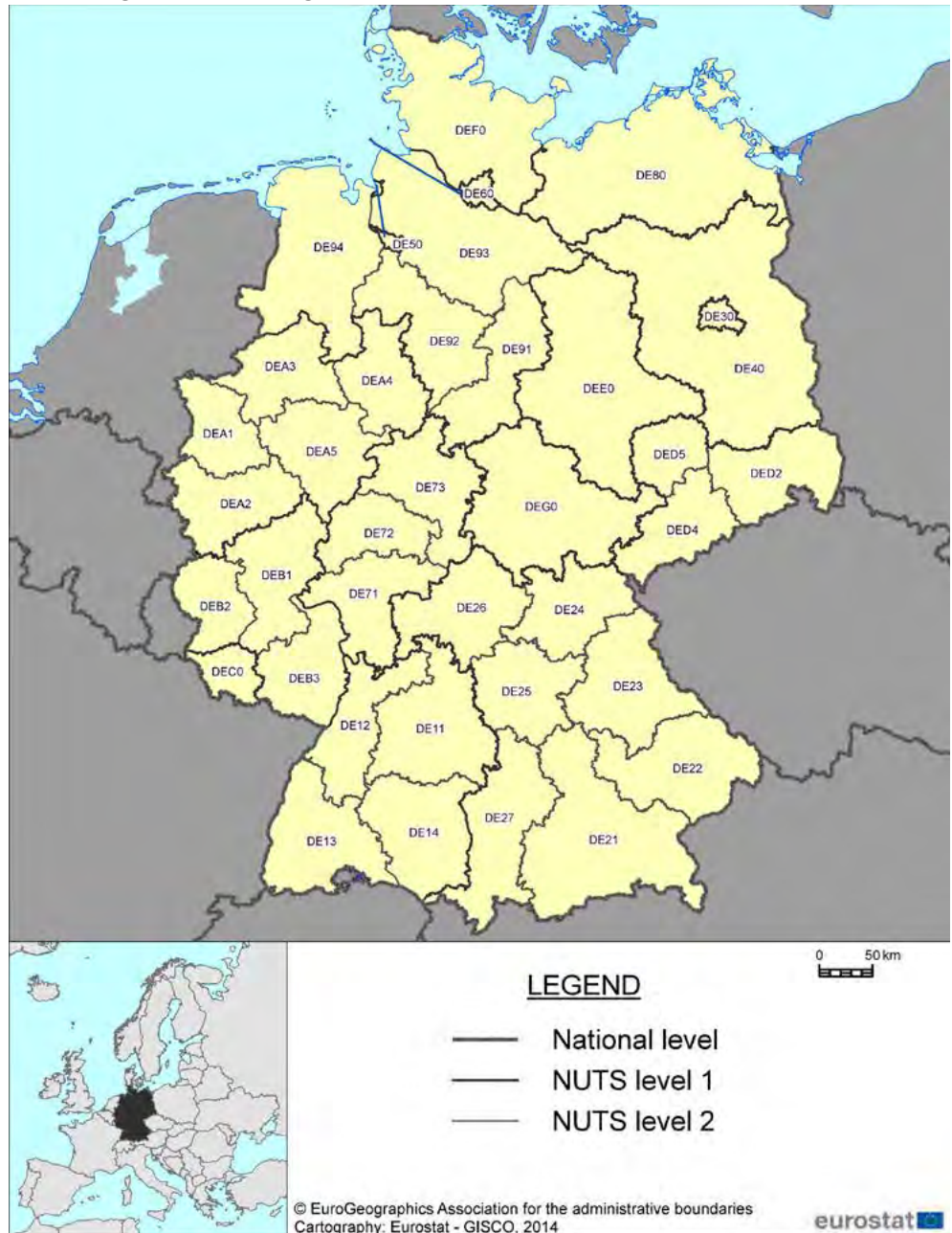
Abbildung 5: NUTS-2-Regionen der Bundesrepublik Deutschland

Trotz des Bestrebens, Regionen vergleichbarer Größe ein und derselben NUTS-Ebene zuzuordnen, gibt es auf den einzelnen Ebenen nach wie vor Regionen, die sich hinsichtlich der Fläche, der Bevölkerung, der Wirtschaftskraft oder ihrer Stellung in der Verwaltungshierarchie deutlich voneinander unterscheiden. Diese Heterogenität innerhalb der Gemeinschaft spiegelt in vielen Fällen einfach die Situation auf der Ebene der Mitgliedsstaaten wider. Zur Vervollständigung des NUTS-Modells sei im Folgenden noch die Ebene 3 grafisch dargestellt.