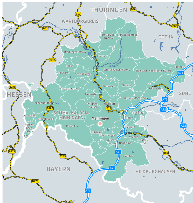
Abbildung 1: Lage der Stadt Schmalkalden

Die Stadt gehört zum Landkreis Schmalkalden-Meiningen, fungiert dort als Mittelzentrum und hat aktuell neben der Kernstadt noch 8 Ortsteile. Nachdem zwischen 1950 und 1978 bereits einige umliegende Orte eingemeindet wurden, kamen 1994 im Zuge der damaligen Kreisreform zunächst Asbach, Grumbach, Möckers, Mittelschmalkalden und Mittelstille hinzu. Seit dem 1. Dezember 2008 ist auch Wernshausen ein Ortsteil von Schmalkalden. Die letzte Gebietsveränderung datiert vom 6. Juli 2018 mit der Eingemeindung von Springstille.