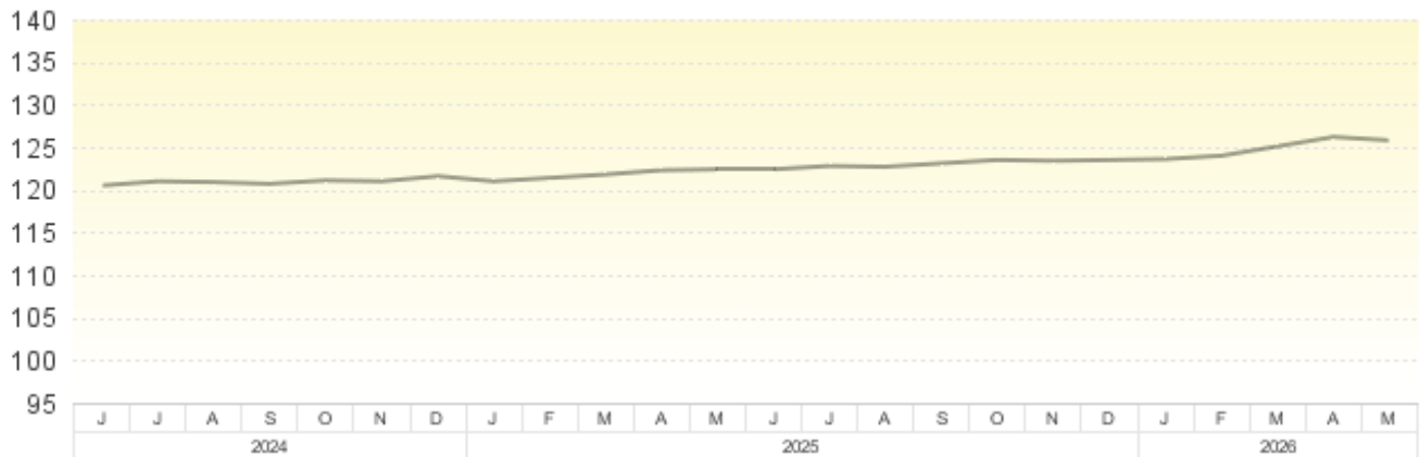
Veränderung gegenüber dem entsprechenden Vorjahresmonat - Jahresteuerungsrate -